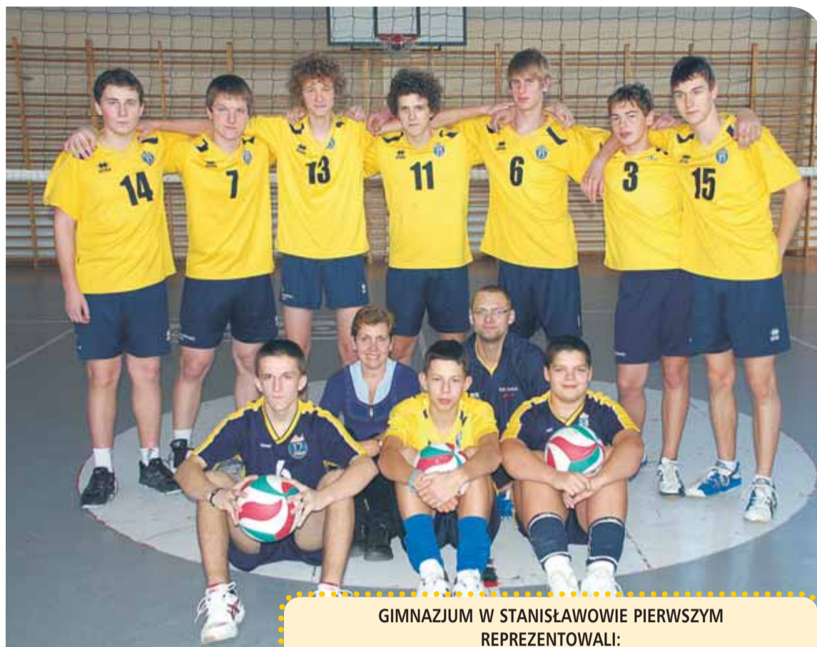
GIMNAZJUM W STANISŁAWOWIE PIERWSZYM REPREZENTOWALI: